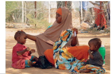
Somalische Flüchtlinge in einem Lager nahe Dadaab

■ Flüchtlinge: Die Situation der mehr als 270 000 somalischen Flüchtlinge in den Flüchtlingslagern nahe der Stadt Dadaab wurde im Mai 2009 u. a. von der Hilfsorganisation Ärzten ohne Grenzen als katastrophal ein-